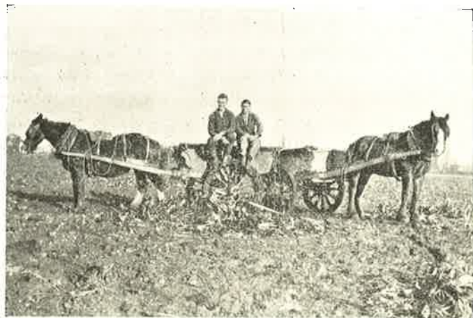
Der køres Roer (England).

Den engelske Natur er meget smuk. Landskaberne er meget bakkede, der er næsten ingen Skove, men allevegne staar Trægrupper, smaa Skove eller enkelte Træer, og langs næsten alle Veje og i Markskel er der Tjørnehække. Kønnest er der ved Themsen. Themsen er opdæmmet og Strømmen er derfor meget svag og bugter sig meget ud og ind i den brede græsgrøede