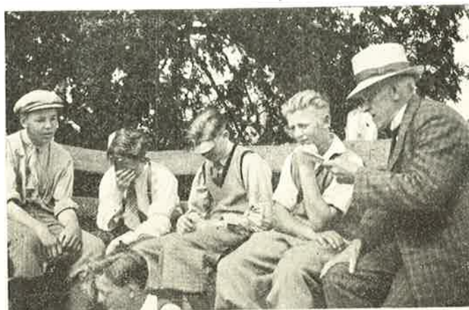
Digteren læser egne Værker.

I Vordingborg var det naturligvis Slotsruinerne med Gaasetaarnet, der tiltrak sig vor Opmærksomhed mest. Der var vi inde i en Have med middelalderligt Præg, d. v. s. den havde Lighed med de gamle Klosterhaver. Her var Giftplanter og Lægeurter af forskellige Arter,