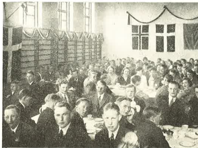
Fra Elevmødet 1933.

Hvad er der saa mere? Ja, efter Cykleturen til Møens Klint deltog min Hustru og jeg i et Kursus paa Krabbesholm Højskole, hvor vi oplevede meget, og hvorfra vi