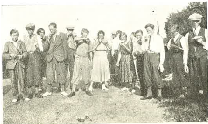
Melonspisning paa Landevejen.