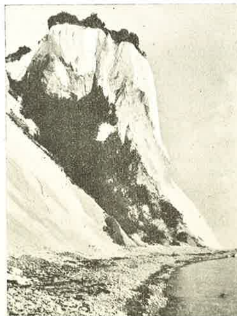
Møens Klint: Vitmundsnakke.

Naa, Begyndelsen blev spændende nok. Vi forvildede os i Højemøens Skove, kom ind paa vildsomme, tilsidst overgroede og ufremkommelige Stier, hvor vi maatte bære Cyklerne over vindfældede Træer, tradske gennem