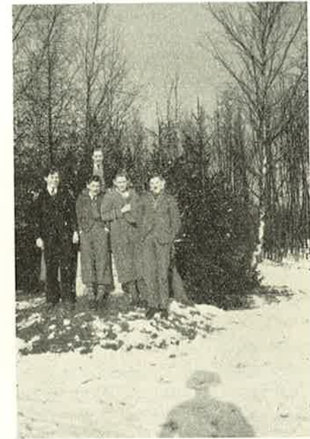
»Skynd dig, vi fryser!«

Besøg hos Venner og Bekendte, eller de var blevet forsinket ved en lille Maaneskinstur med Vandkanden paa Taget. Nok er det, de gav deres Beundring saa tydeligt til Kende, at Forestillingen maatte afbrydes paa en lidt brat Maade. Og som bemeldte Forestilling endte brat vil jeg ogsaa gøre det. Skulde jeg fortsætte Oprulningen af de mange skiftende Billeder fra Vinteren 1934, vilde det langt overskride den Plads, som Redaktøren har stillet til min Raadighed — og selvfølgelig, det er jo ikke alt, en Lærer er à jour med. Naar Eleverne samles