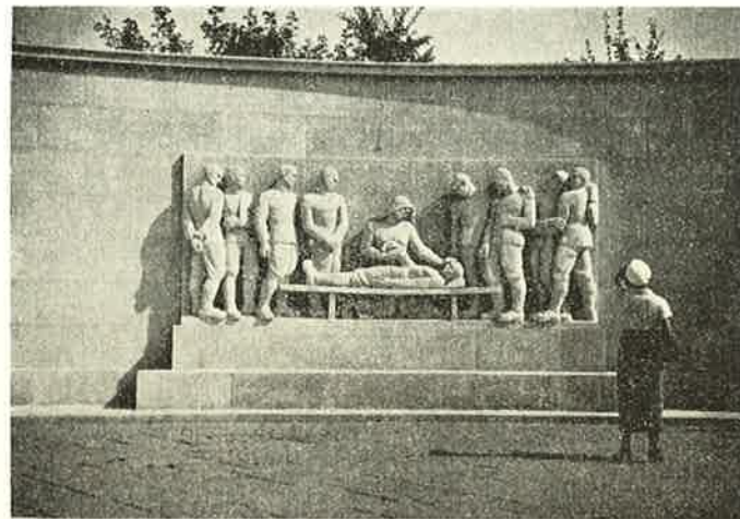
Mindeparken i Aarhus: »Hjemkomsten«.

Der faldt en, dræbt af en Landsmand, en anden springer til og trøster den døende — mere Lidelse —