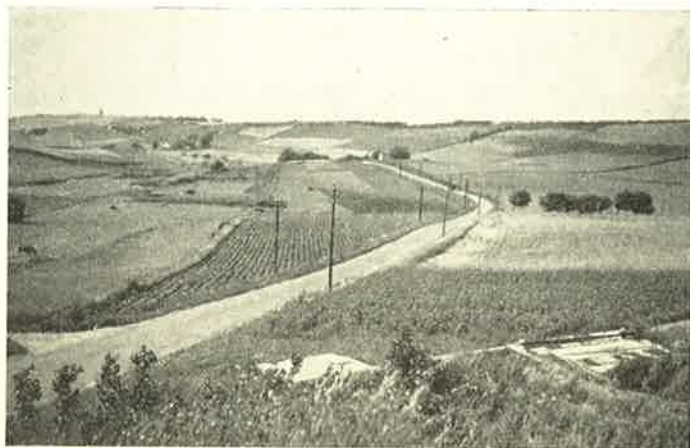
Udsigt fra Stenstrup Troldhøje mod Lumbsaas.

da Klokken var halv tre, startede vi igen. Turen gjaldt nu foreløbig Stenstrup, hvor vi skulde se en gammel Jættestue. Vejen derop var ikke videre god, men saa var Landskabet til Gengæld saa meget smukkere. Jættestuen i Stenstrup er meget stor, der er to Kamre, hver med Plads til 60 døde. Da vi alle havde været inde i Højen, kørte vi videre ud til Oddens Museum, som