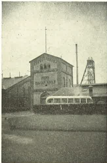
Kulgrube i Höganäs.

Kl. 8 næste Morgen lød Startsignalet. Den Dag havde vi ikke særlig travlt, vi skulde kun køre 60 km. Foreløbig skulde vi til Fredensborg. Kl. 9 naaede vi Fredensborg. Efter en interessant Gennemgang af Parken