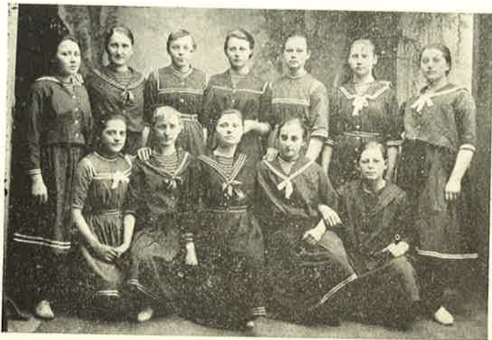
Pigehold fra Ringe i 1880erne. (Forfatteren i Midten forrest).

holde Orden i Landet, for der var en Mand, som havde skudt en Knap af Estrups Frakke, og saa skulde der ordentlig passes paa os allesammen. Gendarmerne var i lyseblaa Uniformer, hvorfor vi kaldte dem „De lyseblaa“. Vi havde saadan et Par „Lyseblaa“ stationeret i Ringe, og vi Piger opdagede, at de kiggede ind gennem Ruderne i Øvelseshuset en Aften, vi havde Gymnastik,