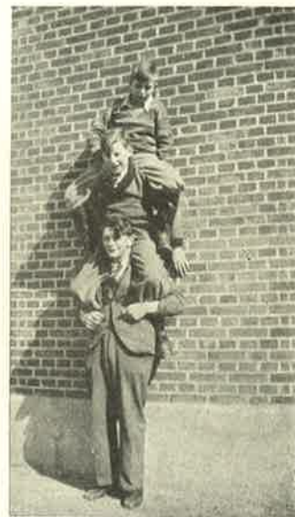
Tre Mand høj.

Elevmødet (d. 7. Juni) med den egentlige Jubilæumsfest paa Højskolehotellet havde vundet stor Tilslutning, og Festen forløb efter min Mening i enhver Henseende godt. Referatet fortæller om den. Men hverken I eller Referenterne har nogen Anelse om, hvad der i de to Dage strømmede ind til Skolen af Telegrammer, Breve, Blomster og Blomsterkurve fra gamle Elever, Lærere og Venner af Skolen. Vi følte rigtig i de to Dage, at vi er omgivet af en stor Vennekreds. Vi vil derfor gerne sige rigtig mange Tak til saa mange, som vi ad denne Vej kan naa, for hvad I, hver paa sin Maade, har bidraget til at gøre Jubilæet saa festligt, som det blev.