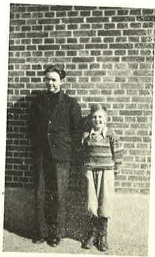
Fyrtaarnet og Bivognen.

da Teaterdirektøren sidste Vinter ikke vilde give billige Billetter for Skoleelever, fik vi ingen Teatertur. Men som Erstatning fik vi et Par gode Aftenunderholdninger i Ringe. Først (d. 18. Febr.)