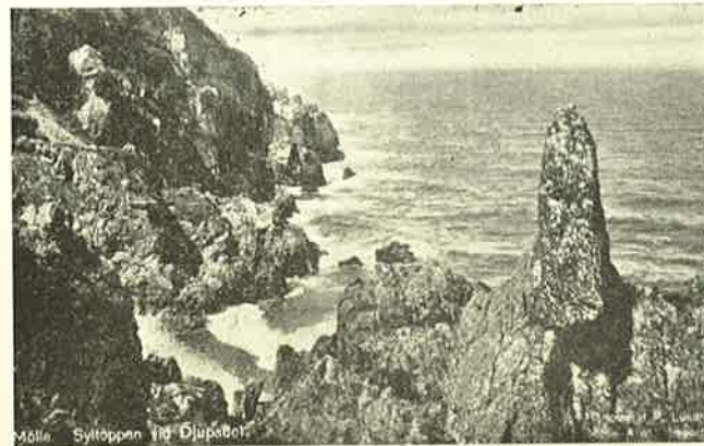
Parti fra Kullen.

Alle de Trin. Men op kom vi dog, og saa gik vi videre over et Stykke Land bevokset med Blaabær og Lyng, indtil vi naaede Djupadal. Her skulde vi igen ned. Nedturen gik som første Gang meget let, men opad, uha, uha, det var vel nok drøjt. Nu fortsatte vi hele Vejen igennem Djupadal til vi naaede Hovedvejen, hvor Bilen ventede. Middagsmaden skulde vi spise i Mølle,