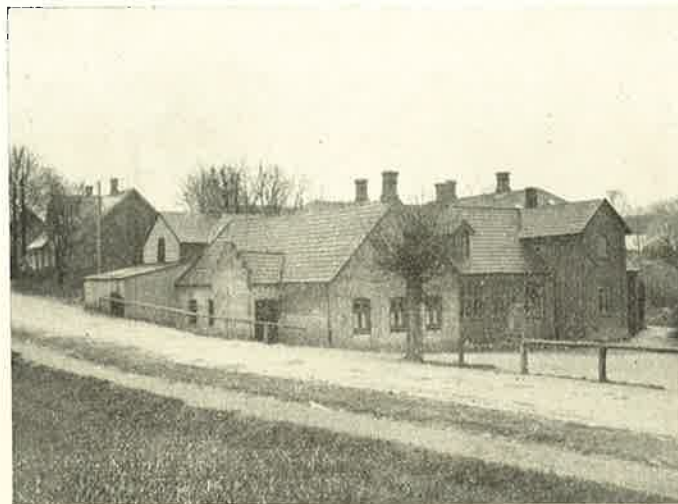
Skolen i 1915.