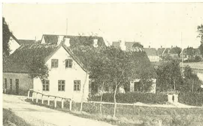
Skolen i 1886.

Skolen voksede ret hurtigt, allerede i 1890 havde den 23 Elever, men dens økonomiske Kaar var i mange