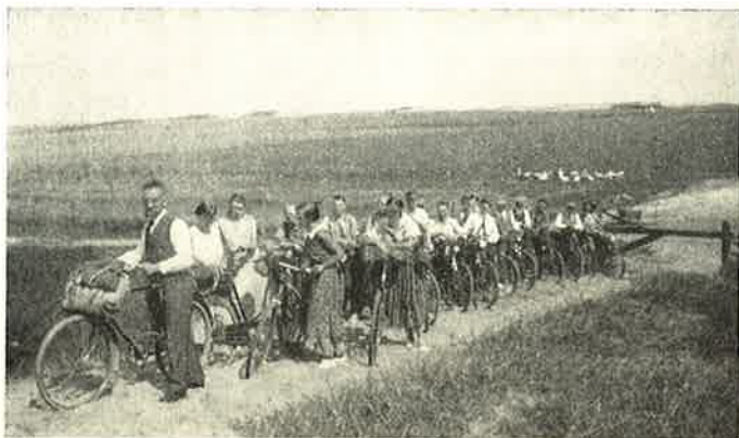
Paa Cykletur med Efterskolen.