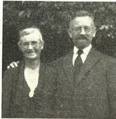
Paa Sølvbrullupsdagen tre Uger før Dødsfaldet.

Han døde fredelig og stille, i Fred med sig selv og i Fred med sin Gud, og han døde som en lykkelig Mand, lykkelig i sin Gerning og sit Hjem, og det at faa Lov