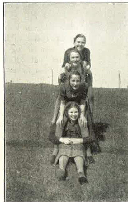
Et glad Firklover.