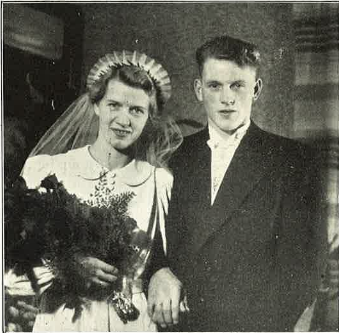
„To, som gerne vil sammen være“.