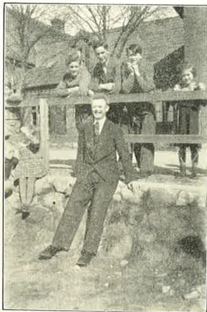
Larsen morer sig.

I Marts overværede vi Generalprøven paa Ringe Gymnastikforenings Dilletantforestilling, Stykket, der hed „Min egen Dreng“, varede i 3½ Time, saa vi fik Valuta for den 25 Øre.