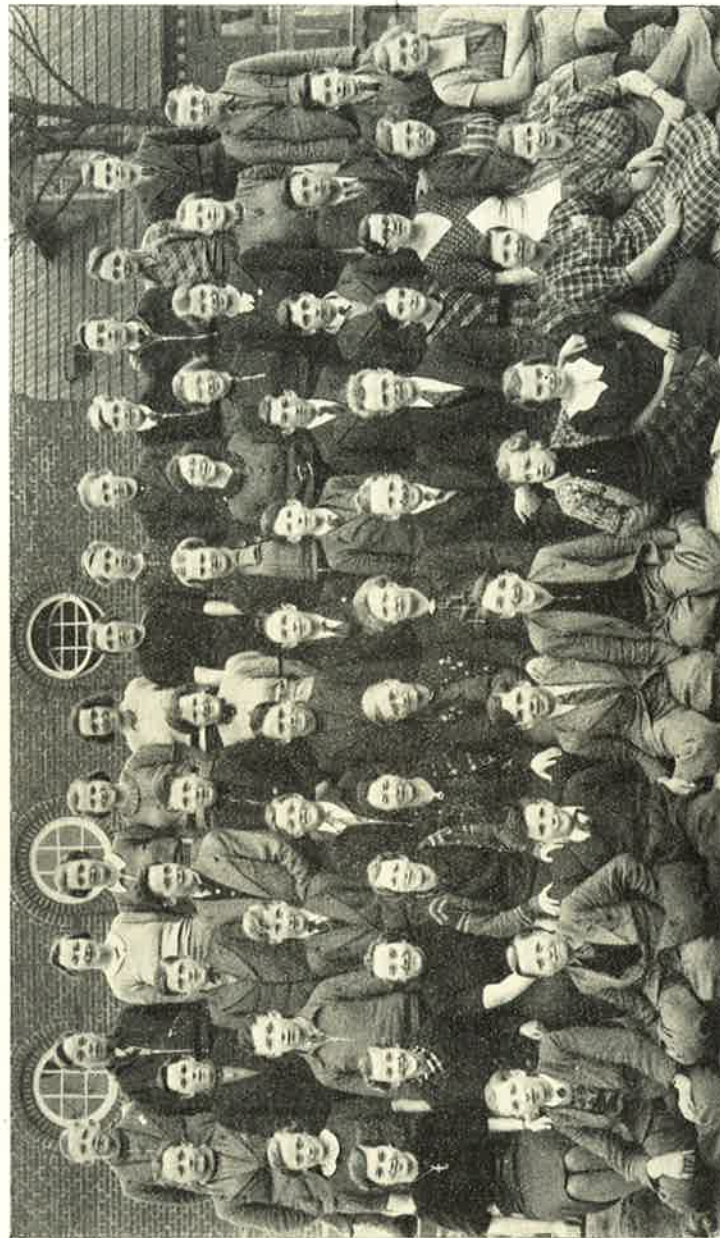
Eleveholdet 1938 - 39.