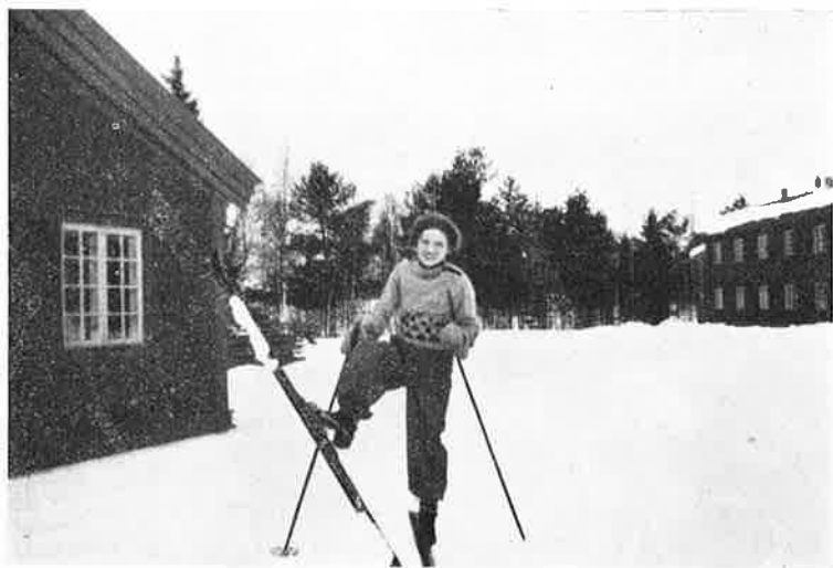
Man maa krybe —

Og i Sandhed en rask og moderne Ungdom, der ikke i