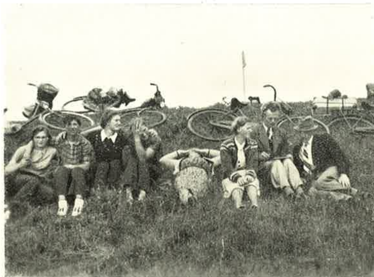
Hvil i en Grøftkant.

Nu maatte vi til at tænke paa at komme til Fyn igen, og Skanderborg var vort første Maal. Der gjorde vi Holdt ved den private Realskole, hvor vi straks stormede Vandhanen. — Saa var vi henne at se Niels Ebbesens Mindes-