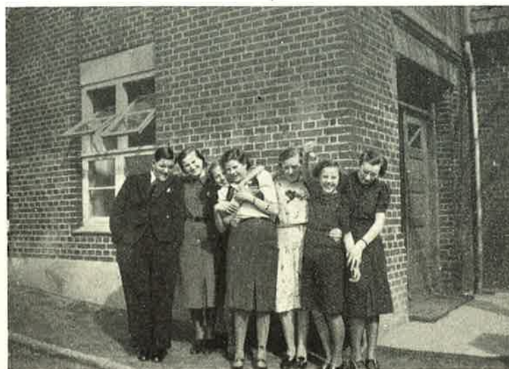
Der slikkes Solskin.

Og saa nærmede Tiden sig for Hjemrejsen til Juleferien, den saa ud til at skulle blive dramatisk. De sidste Dage før Ferien væltede Sneen ned, og Stormen piskede den sammen i store Dynger. I Radioen hørte man gentaget: