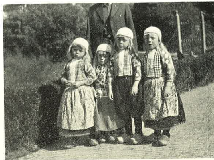
Skolebørn fra Marken.

Øen. De er ikke meget imødekommende overfor fremmede, det maa heller ikke være saa morsomt daglig at skulle overbeglos af nysgerrige og taktløse Turister, men vi faar da til sidst Lov til at kigge indenfor i en Stue. Væggene hænger fulde af malede Tallerkener, en stor Alkove fylder hele Stuens ene Side. Et Bord, et Par Træstole og en mægtig gammel Kiste, det er hele Møbementet, men pyn-