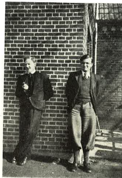
Lærerne har Frikvarter.

Det var med Vemod og med Sorg, at jeg sagde Farvel, det er ikke let at give Slip paa en Livsgerning, man har elsket, men det var ogsaa med taknemlig Glæde, naar jeg tænkte paa alle de mange Aar, min Mand og jeg havde