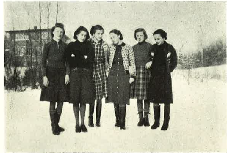
Ude i den kolde Sne —

derimod kom de „pr. Ben“, hvis Afstandene ikke var alt for store. Ofte hændte det, at de Elever, der skulde med Togene, maatte vente flere Timer paa Stationen. Naar saa endelig Toget kom, var Skoletiden næsten forbi. Gymnastikken maatte vi lade udgaa af Timeplanen en lang Tid af Vinteren, da det var umuligt at fyre Salen op, og vi kunde risikere, at de alle frøs fast til Gulvet. Men da der endelig kom Tø i Luften, og vi kunde tage fat igen, sled