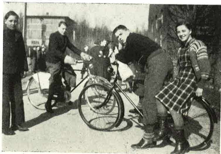
Vil du ha' en Køretur —

rene laa i Vinterhi, men der var alligevel nok at se paa, særlig var Huset med Slanger, Papegøjer o. l. godt besøgt. Der var nemlig dejlig varmt. Tiden slog næppe til, men vi skulde være paa Glasværket til bestemt Tid. At se Glaspusteriet var en Oplevelse; elskværdigt og forekommende viste og forklarede Personalet, hvad man laver Glas af, og hvorledes det gaar til. Eleverne var meget interesserede og var næsten ikke til at faa derfra. —