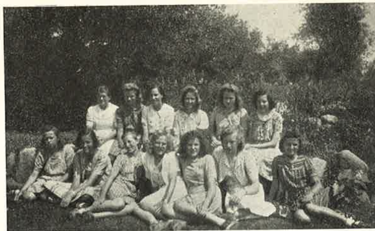
Solskin og Sommer i Haven.