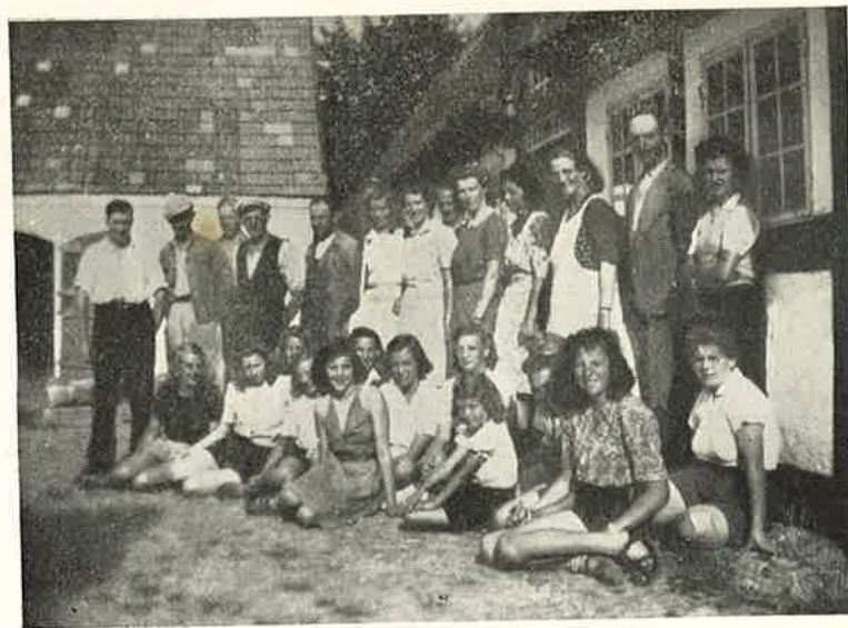
Fra Pigernes Cykletur.