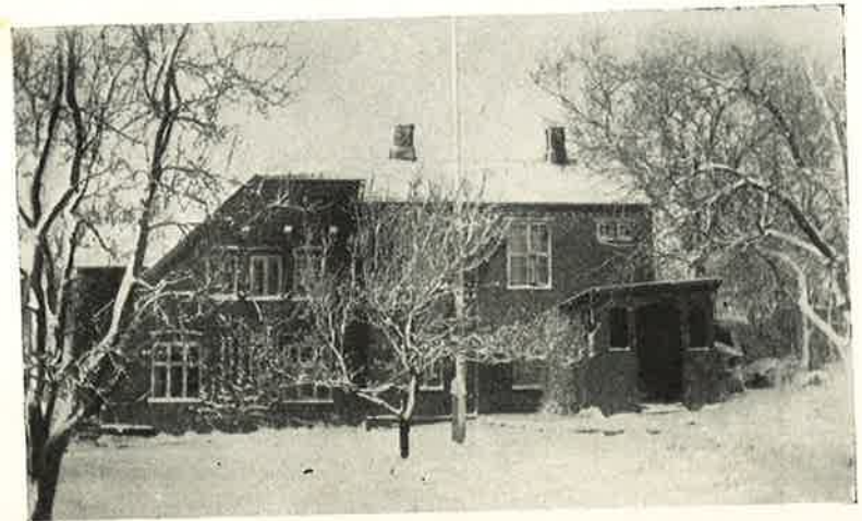
Skolen i Sne.

Vi vil ikke være os selv bekendt; det bedste i os, tør vi