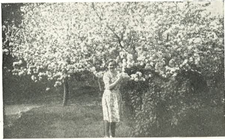
Æbletræerne i Blomst.