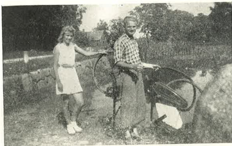
Ak ja, saa sprang den igen!

Utvivlsomt er Fredstanken lige saa gammel som Krigen. Det har sikkert altid været saadan, naar en Mor, Far eller Ven fik Budskabet om den faldne, da meldte Sorgen, Smerthen og Savnet sig hos de efterladte, og dertil føjedes hos alle tænkende Mennesker Spørgsmaalet om Drabets Mening. Dette Spørgsmaal meldte sig vel især, naar den faldne tilhørte den besejrede. Var det ikke meningsløst, naar Uretten ikke hindredes, naar Krigen vitterligt forværrede alt, og Sejren kun var et Udtryk for den stærkestes Ret? I Overvejelser af denne Art ligger sandsynligvis Spiren til Fredsideen. I ældre Tider affandt man sig dog lettere med Krigen. Fredsideen var kun