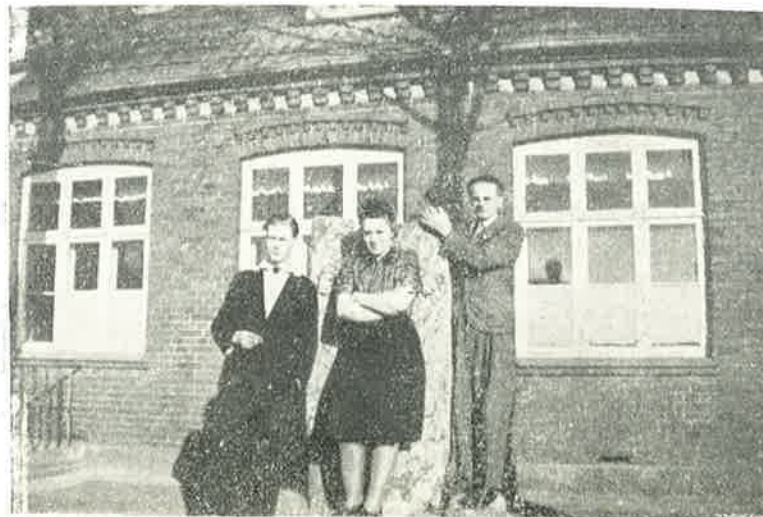
Der slikkes Solskin.

Det var ligesom noget tungt blev taget væk, og inde i os var der noget, som trængte sig frem i en Jubel, der vilde ud, have frit Løb. Men vi kunde daarlige fatte, at nu var Krigen virkelig forbi; netop som den truede med at bryde ind over vor Grænse.