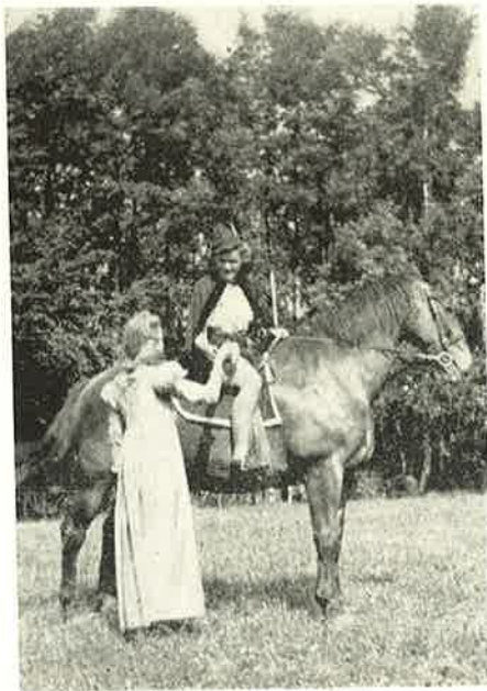
„Elverskud“. Elevmødet 1945.

Vi højste Flaget skønt Klokken nu var halvti. Eleverne sammen med Lærer Nielsen og Frk. Svenstrup gik op gennem Byen syngende nationale Sange, saa det hørtes overalt. Dagmar og jeg gik ogsaa en Tur derop, og Gaden vrirlede af Mennesker— Flagene vajede de fleste Steder, og Frihedskæmperne strømmede til fra alle Sider og satte Vagtposter ved Flygtningelejren.