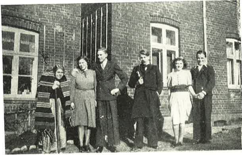
Skuespillerne fra „Den skæve Linie“.