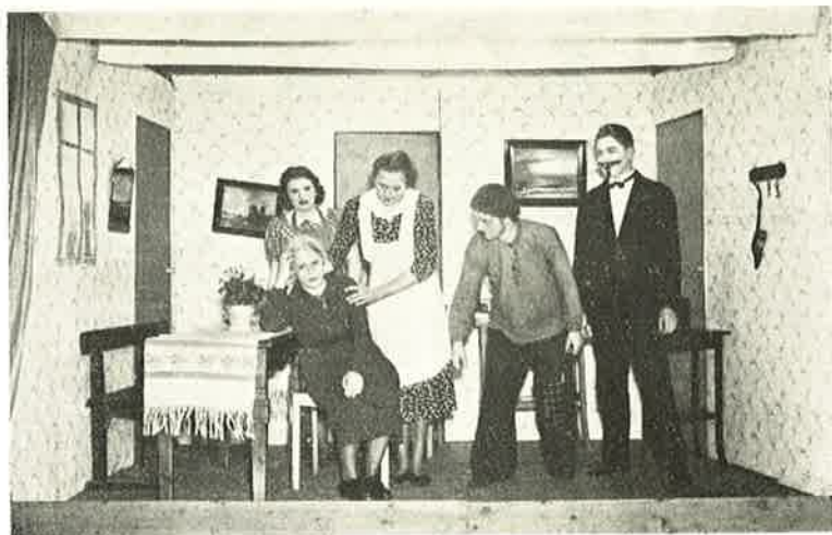
Hygge i Hjemmet.