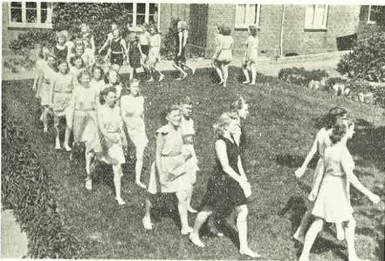
Gymnastik i Haven.

den har noget af Helligdagspræget over sig. Da vi gik tilbage gennem Skoven, var Fuglene vaagner og der lød en jublende Morgensang gennem Skovens Kroner.