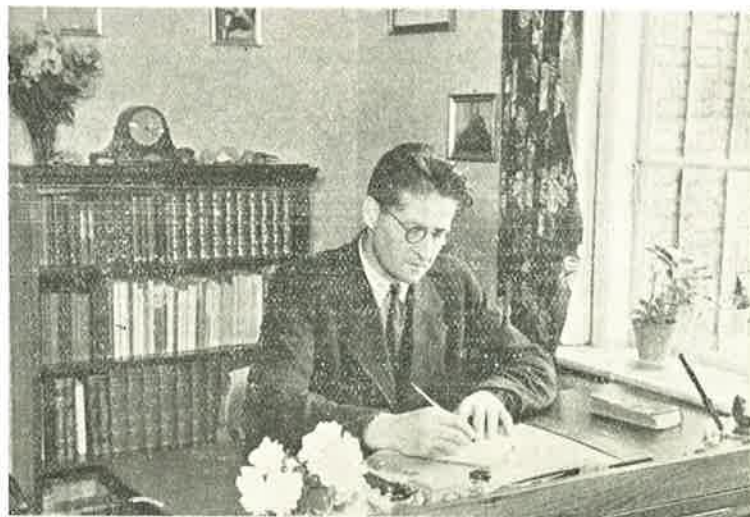
Der er ogsaa lidt Regnskab.

Blandt mange unge var der allerede under Krigen et stærkt Ønske om at være med til at yde en Indsats for at læge nogle af de Saar, Krigen førte med sig. Forskellige Organisationer drøftede under Krigen Planerne for et Hjælpearbejde. Resultatet blev, at der blev oprettet en Komite for Fredsvennernes Hjælpearbejde, der saa det som sin Opgave at bidrage til at genopbygge Verden baade materielt og aandeligt — for en aandelig Genopbygning var nødvendig, hvis en ny Krig skulde undgaas.