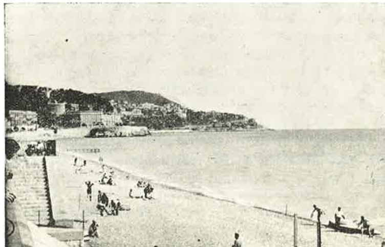
Revieraen i Cannes.

På vej til Marseilles kom vi igennem Cannes, hvor vi havde et ophold på fire timer. Her kunne jeg godt tænke mig at være resten af livet. Der var rigtig sandstrand her. Ellers ligner byen Nice og har samme luksusprægede stil. Cannes har en stor lystbådehavn, hvor alle millionærerne har deres fartøjer. I de store bugter langs kysten ligger mange amerikanske krigsskibe. Ud for Cannes lå der to store hangarskibe, og overalt traf man på amerikanske marinesoldater; mærkeligt nok så vi ikke mange franske.