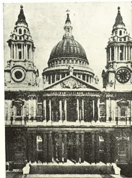
St. Paul's Cathedral, London

som den anden unge pige kendte, til at besøge os i julen, hun var bange for, at vi ville komme til at længes hjem. De boede i Farsley. Vi fejrede dansk juleaften. Fruen havde købt juletræ, and og gaver til os. Vi havde ikke stearinlys på træet, men kulørte lamper, det var noget så kønt. Der var ingen af os fire, der havde været hjem-