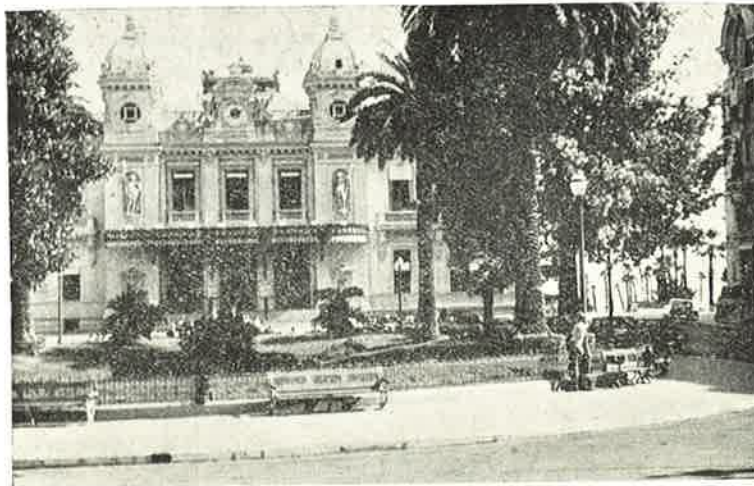
Spillecasinoet i Monte Carlo.

Den aften var det lidt køligt som følge af den kolde luft, der strømmede ned fra bjergene, så vi fik os nogle