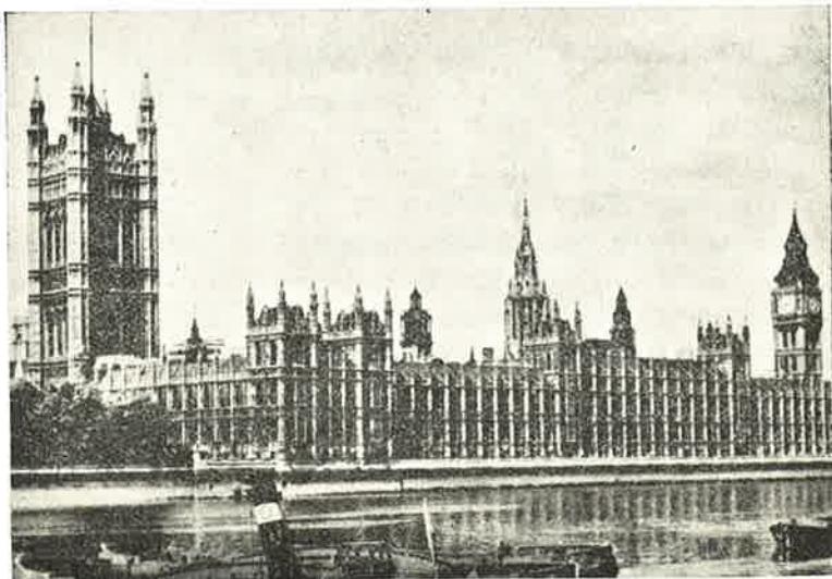
Houses of Parliament, London.

forbindelser, så de kan jo få lidt uden om. Vi fik gode pakker fra Danmark.