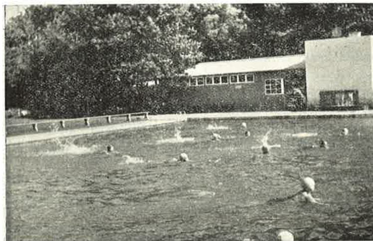
En dejlig svømmetur.

steder blev vi gæstfrit modtaget og godt beværtet med kaffe og sodavand. Det er altid morsomt at besøge »gamle« elever og se dem i hjemlige folder.