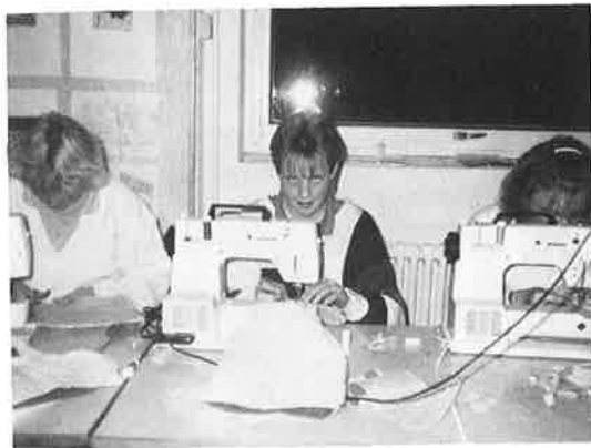
Arbejdet monteres. Dyb koncentration.