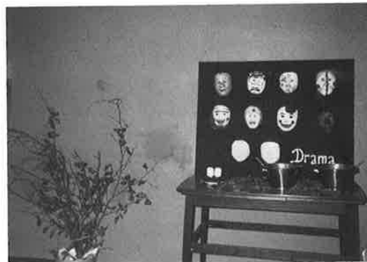
10 vidt forskellige gibsmasker.

individuelle broderier. Det kom der 13 fine broderede træer ud af, monteret til et vægtæppe, som pynter en af væggene i friskolen.