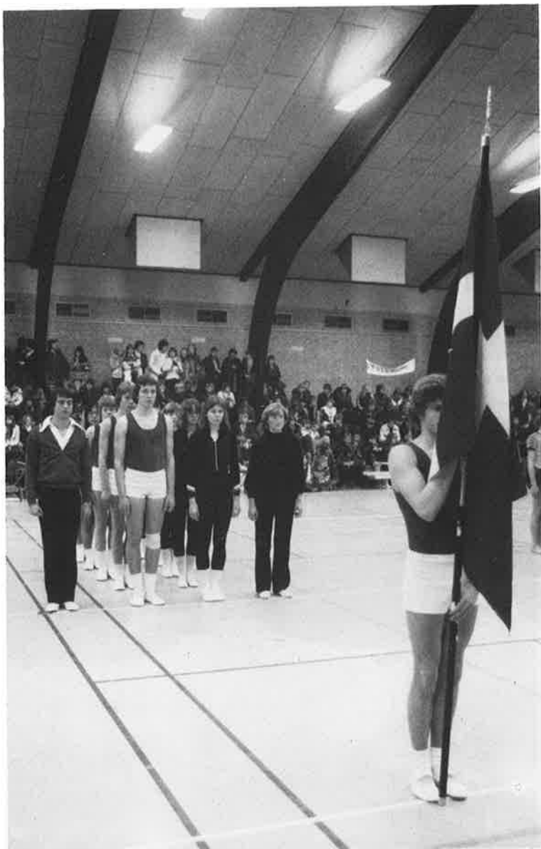
Indmarch i Ringe Hallen.