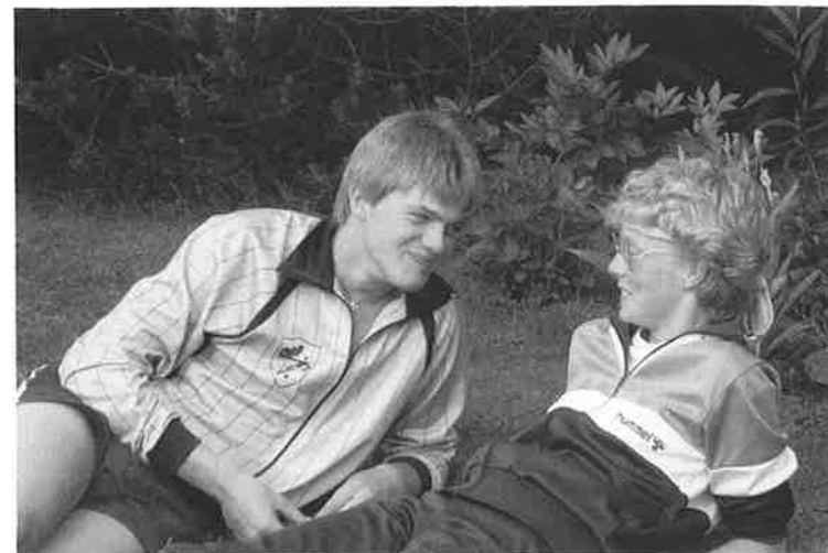
Skønt at gå på efterskole.