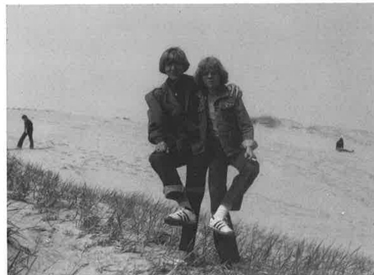
Lejrskole i Frederikshavn. – Di-sko.