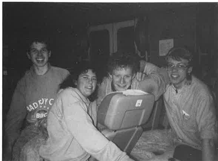
Hjem fra skitur.