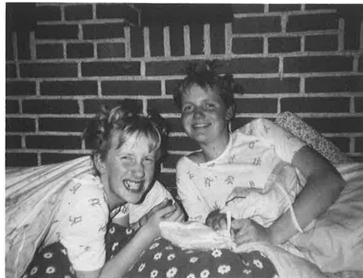
Er der film i kameraet.