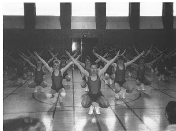
Opvisning ved forældredagen.