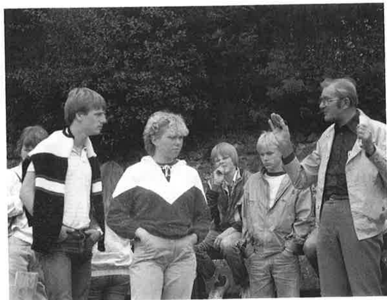
Rubeck fortæller om Danevirke.