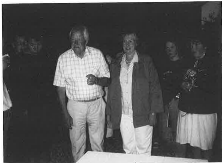
Afslutning på »Kjærsgård«.

18/6 Skoleårets sidste dag. Forældrene ankommer kl. 10.00 og efter fælles morgen-ta-selv-bord er det tid til vi alle skal tage afsked med hinanden – selvfølgelig ikke uden en enkelt tåre.