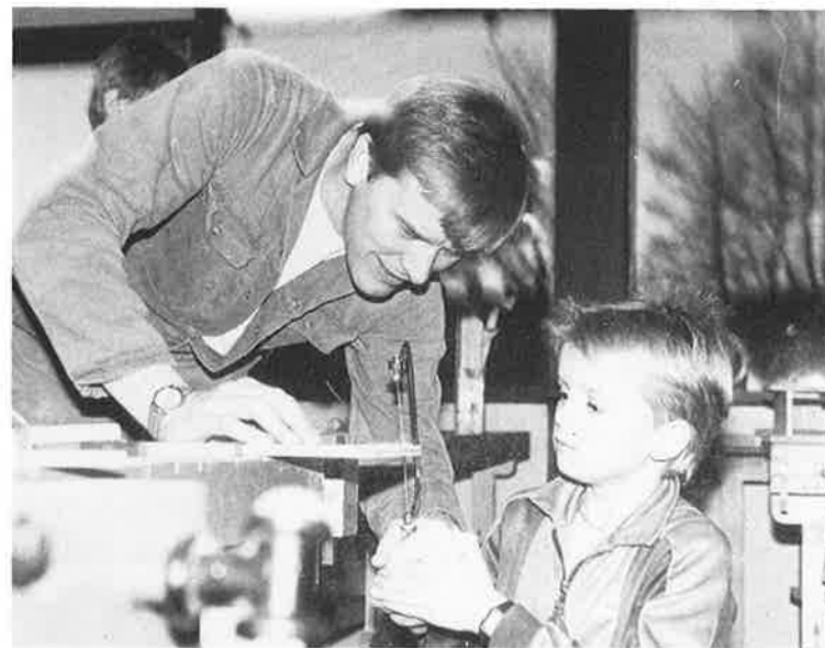
Sådan skal du gøre.