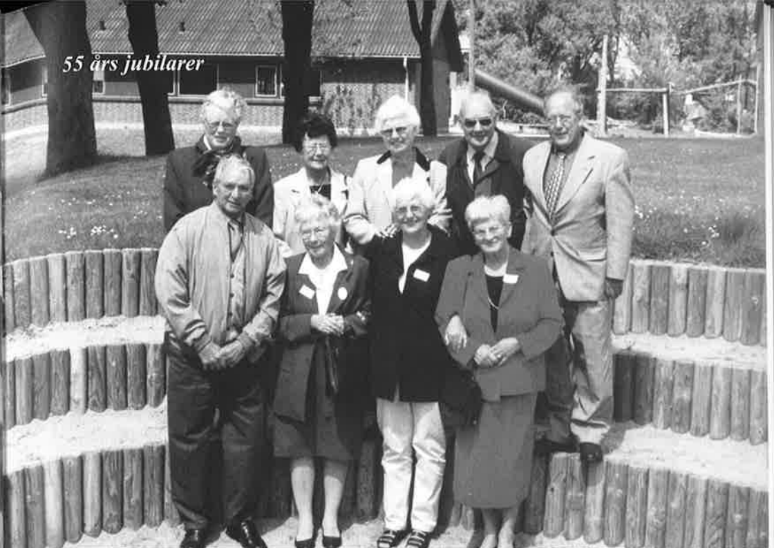
55 års jubilarer