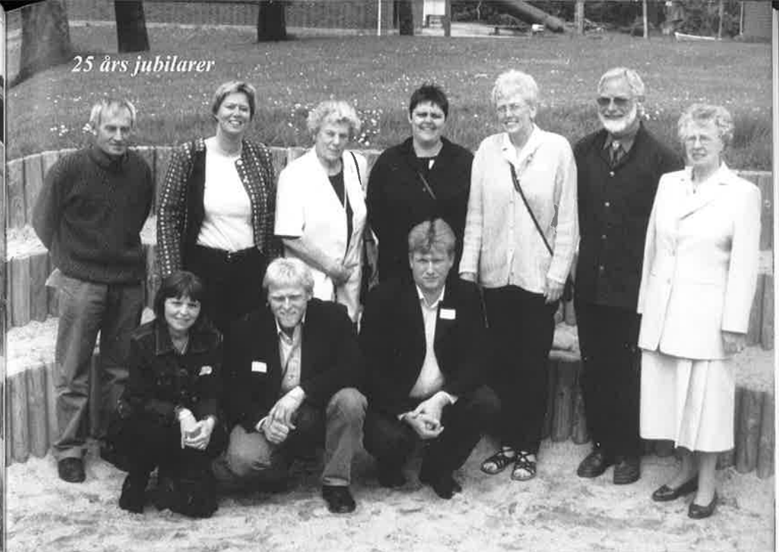
25 års jubilarer