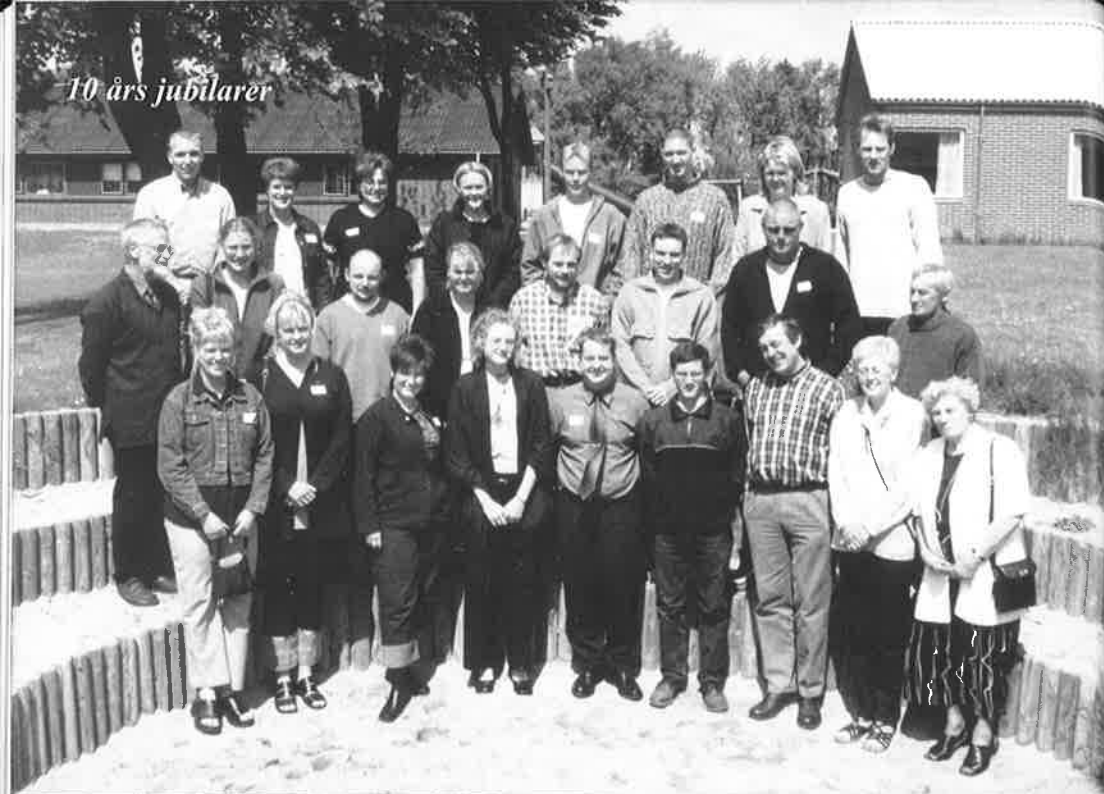
10 års jubilarer