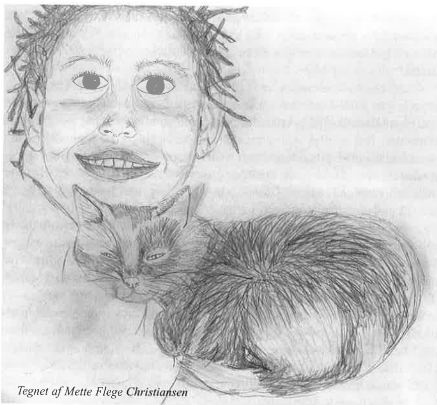
Tegnet af Mette Flege Christiansen