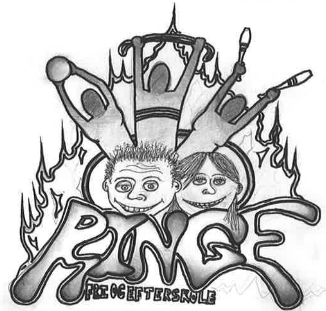
Tegnet af Steven Taylor