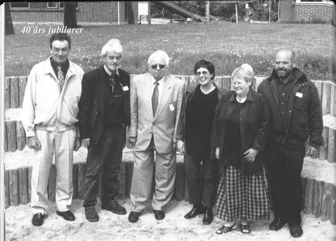
40 års jubilarer