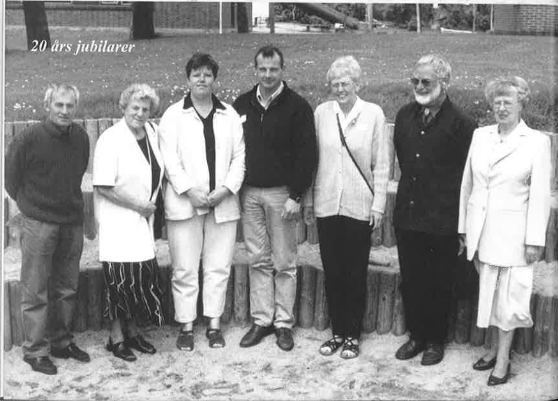
20 års jubilarer