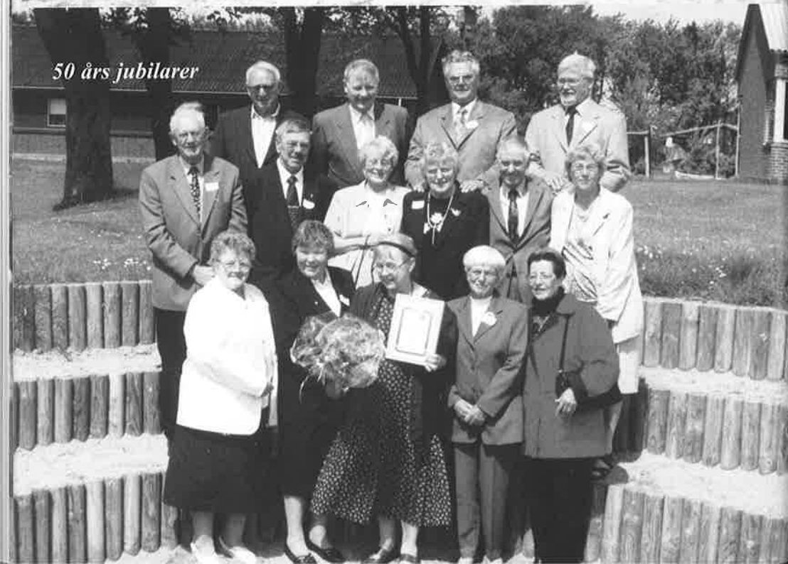
50 års jubilarer