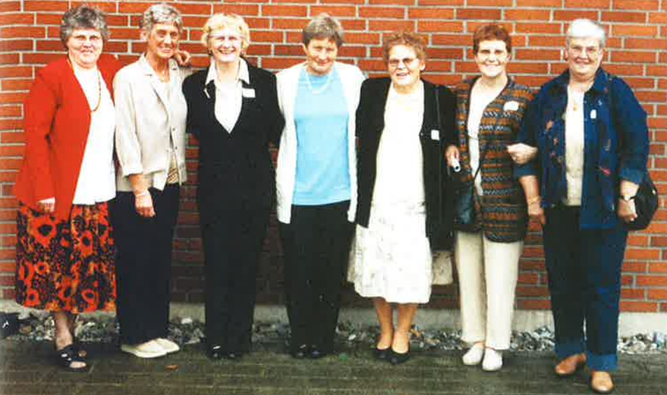
60 års jubilarer