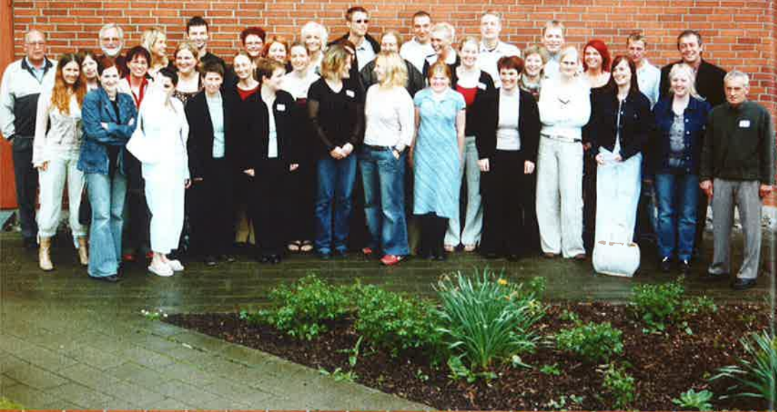
10 års jubilarer