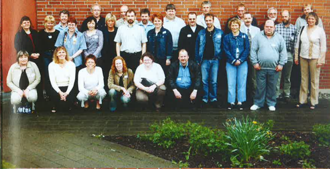
25 års jubilarer