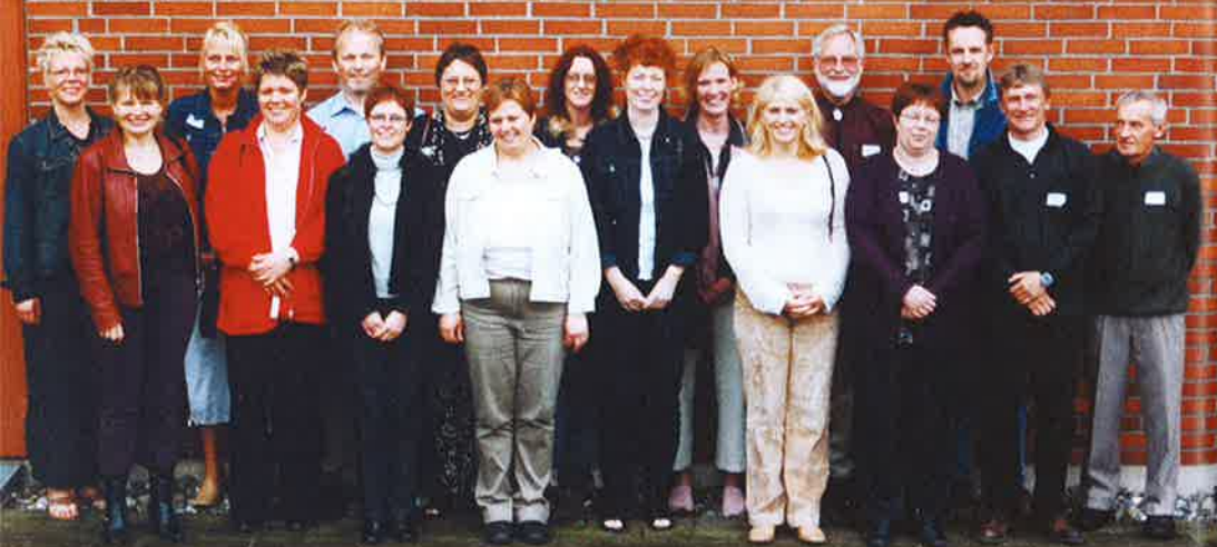
20 års jubilarer