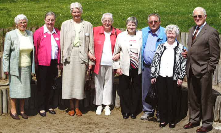
55 års jubilarer