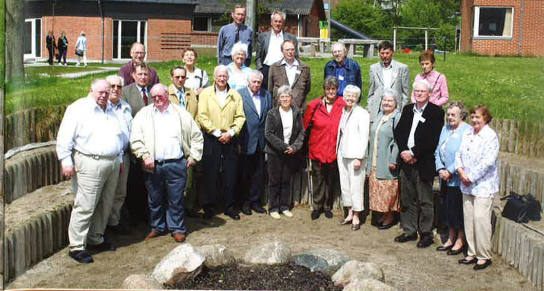
50 års jubilarer