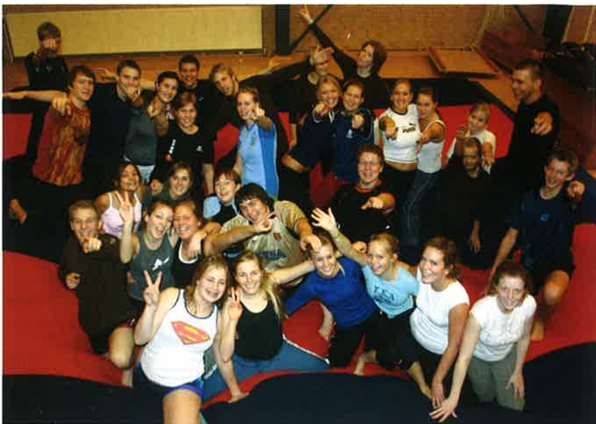
Igen i år har vi mange søskende til tidligere elever gående på skolen. Her fremvises et samlet foto af dem, og hver enkelt kan så prøve at gætte eller genkende, hvem de er søskende til.

Der er meget langt til vores politikere i folketinget i denne henseende!! De vil åbenbart ikke forstå, at det både kan betale sig rent økonomisk for Danmark, at sende de unge i 10. klasse på efterskole, og at det ikke mindst menneskeligt og studieegnethedsmæssigt også kan betale sig.