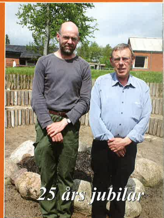
25 års jubilar