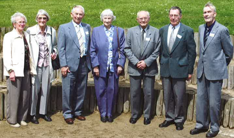
65 års jubilarer