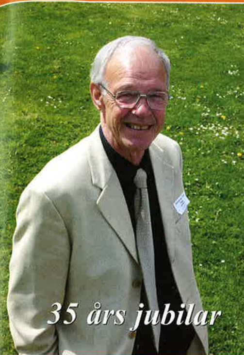
35 års jubilar