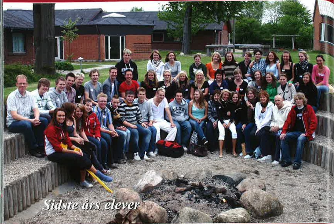
Sidste års elever