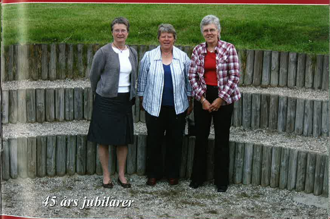
45 års jubilarer