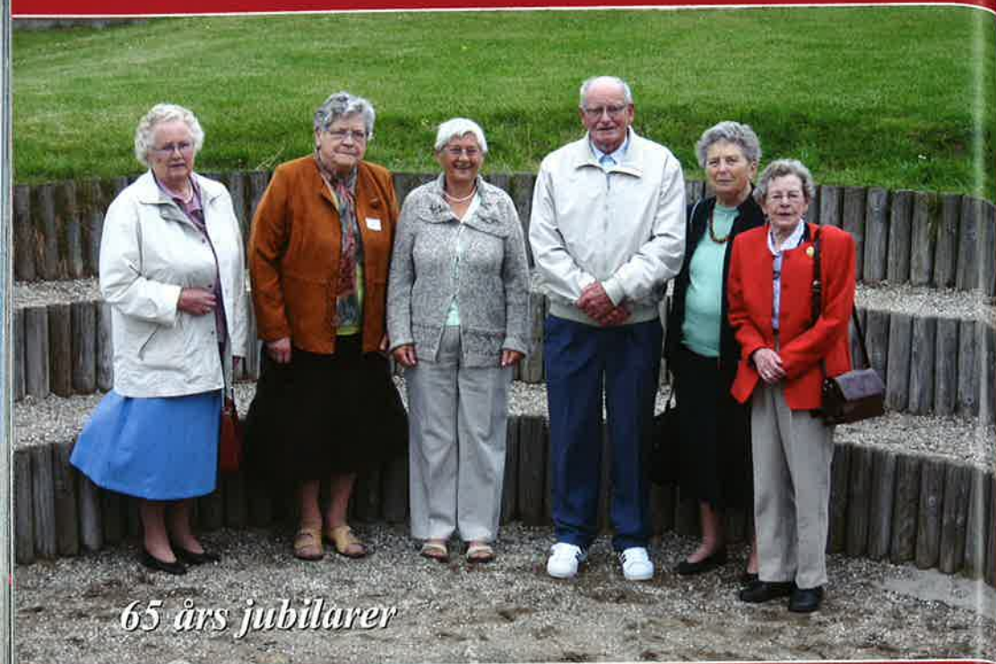
65 års jubilarer