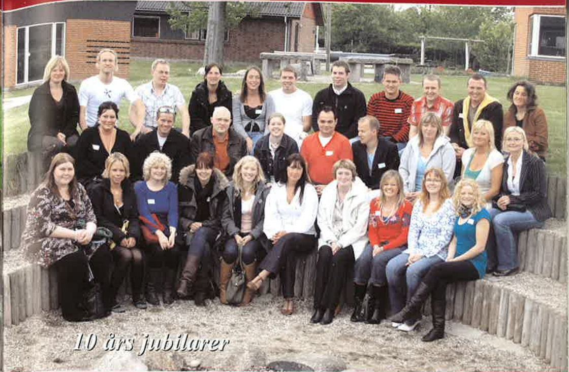
10 års jubilarer