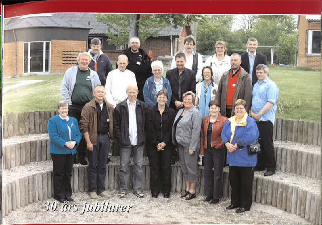
30 års jubilarer