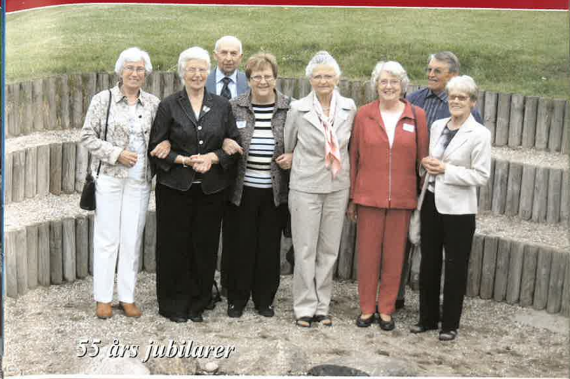
55 års jubilarer