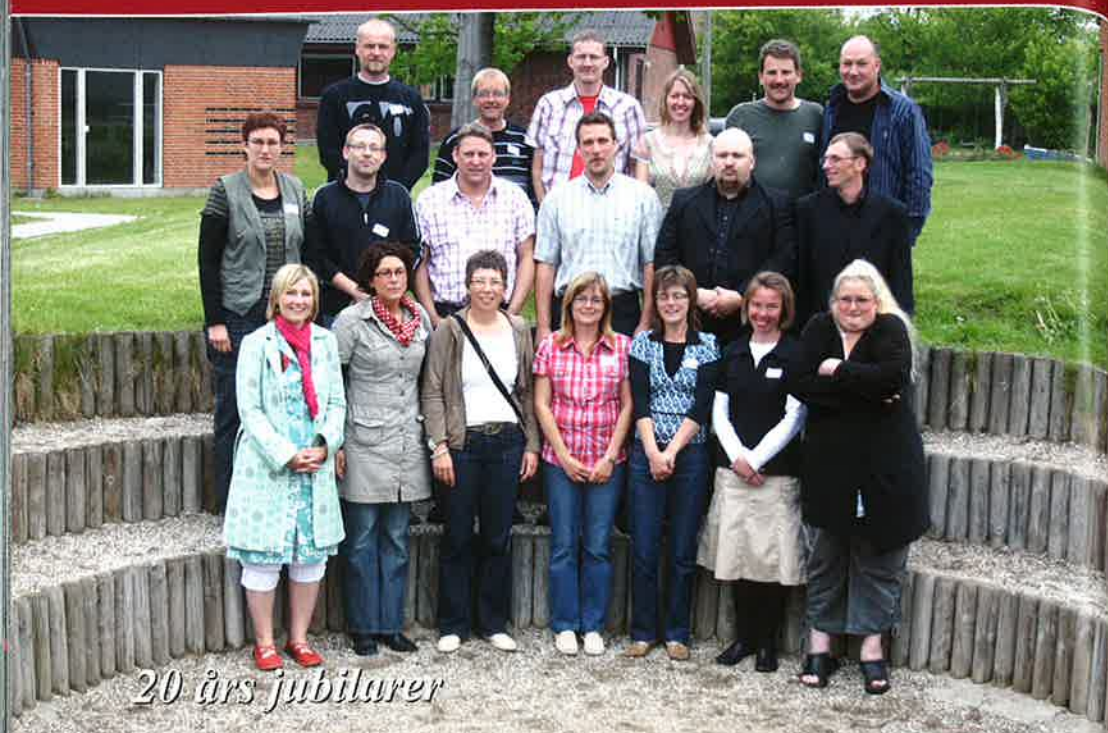
20 års jubilarer