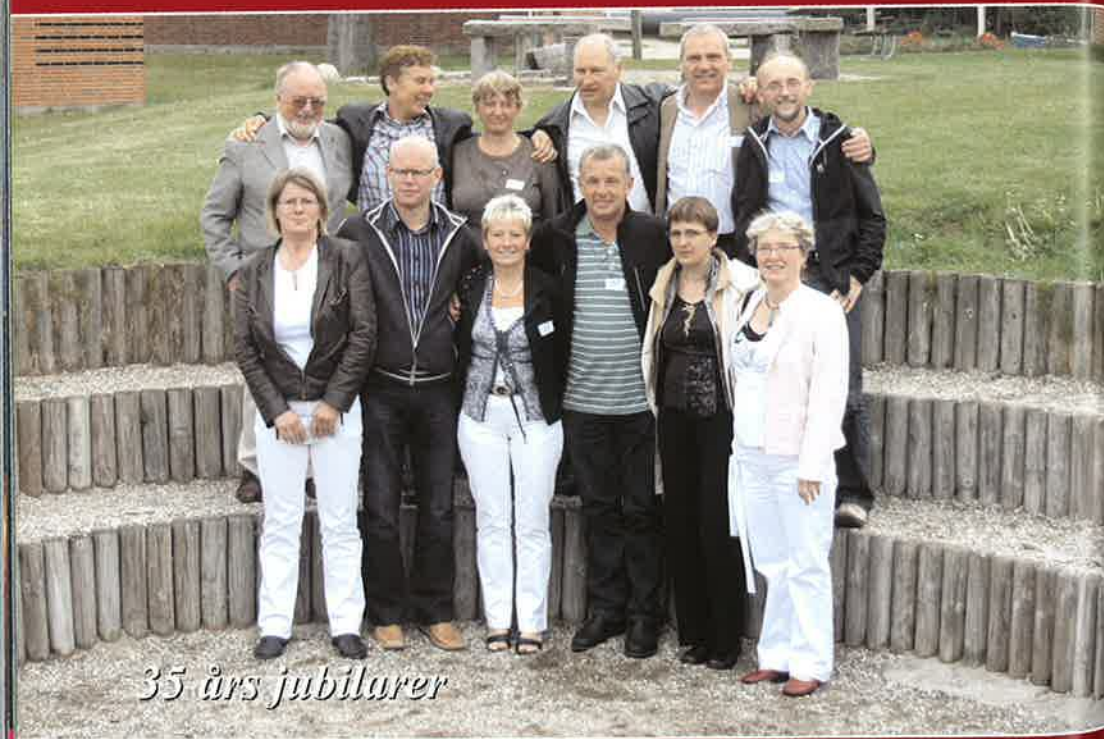
35 års jubilarer