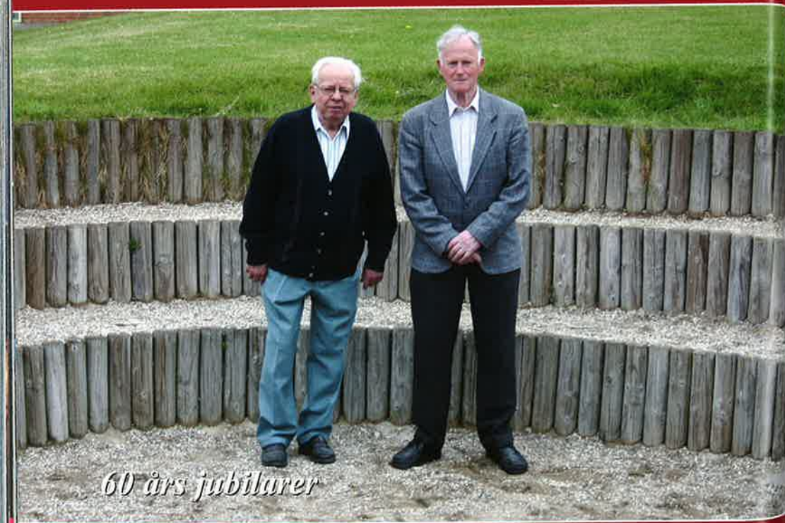
60 års jubilarer