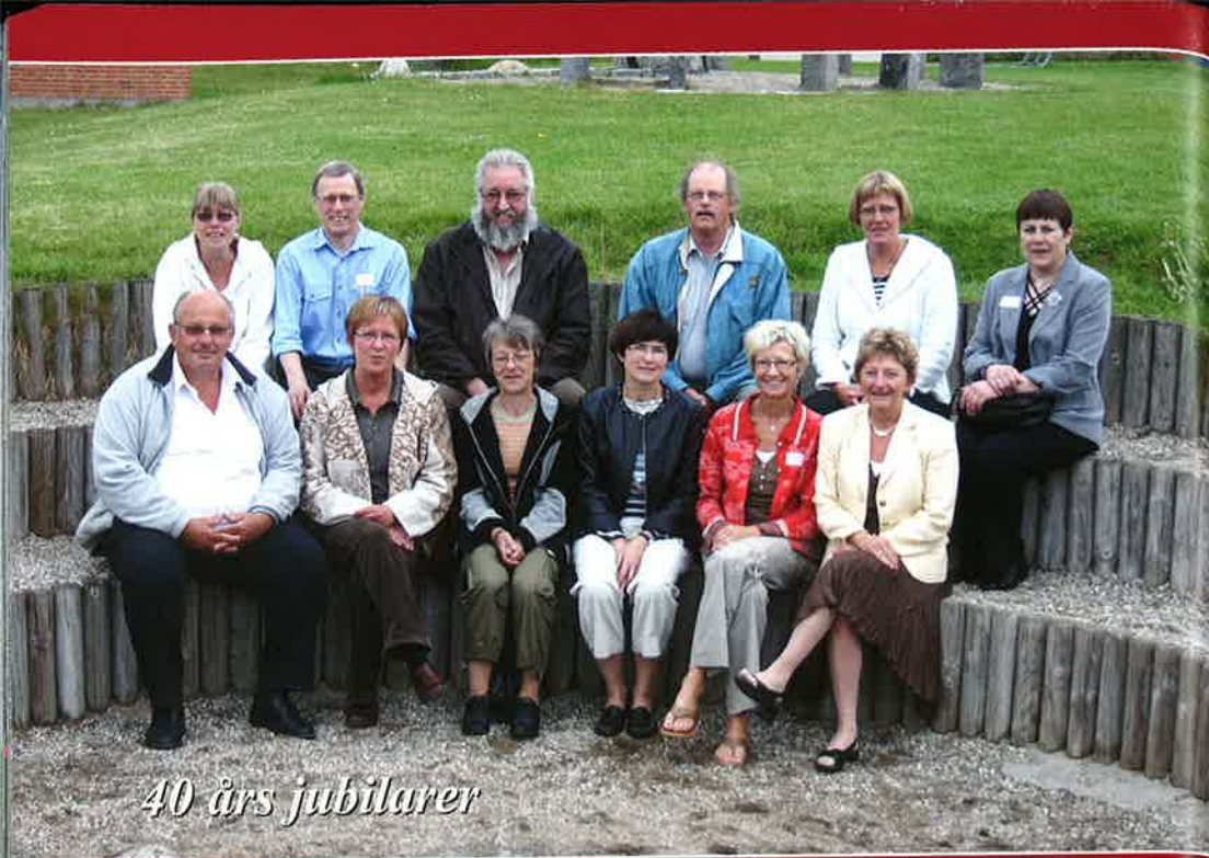
40 års jubilarer