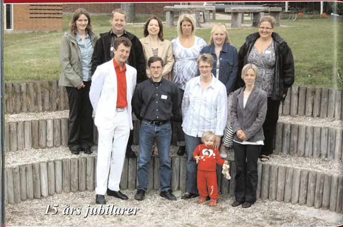
15 års jubilarer