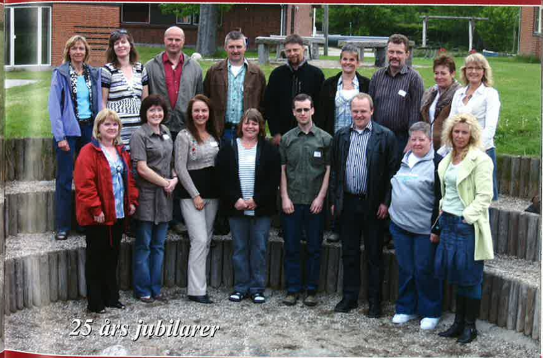
25 års jubilarer