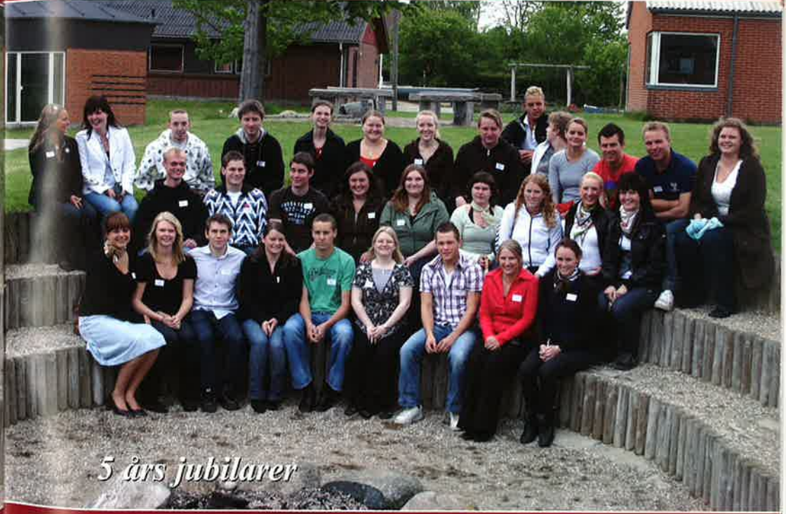
5 års jubilarer