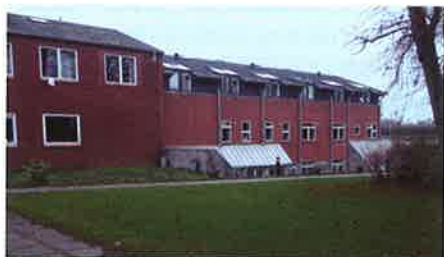
Den nye bygning set fra spisesalen

Noget blev allerede præsenteret i sidste årsskrift, men her er det færdige resultat!