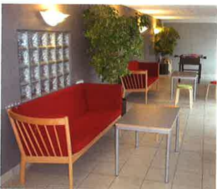
Det nye indgangsparti indeholder bl.a. en opholdsstue, hvor der før var et halvtag i gården.