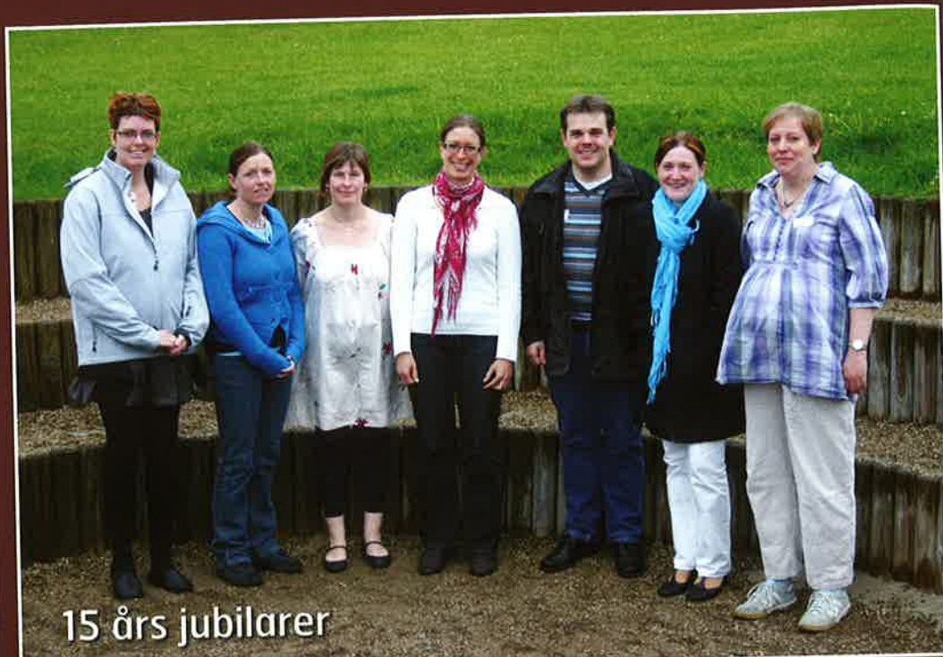
15 års jubilarer