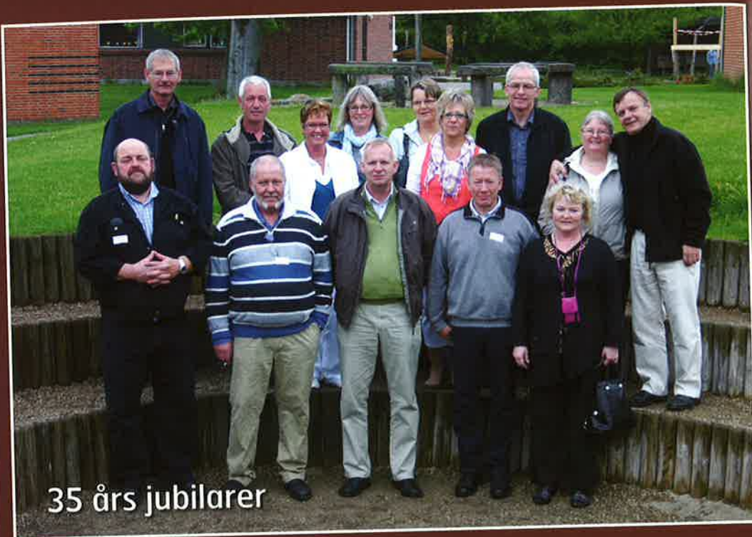
35 års jubilarer