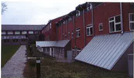
og op mod spisesalen