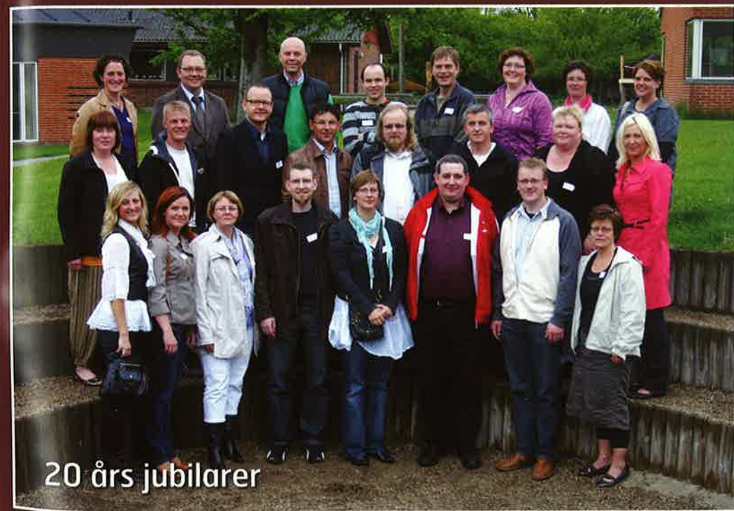
20 års jubilarer