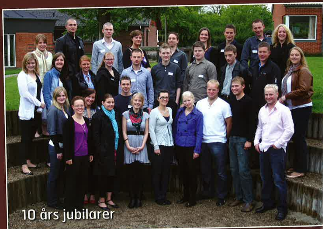
10 års jubilarer