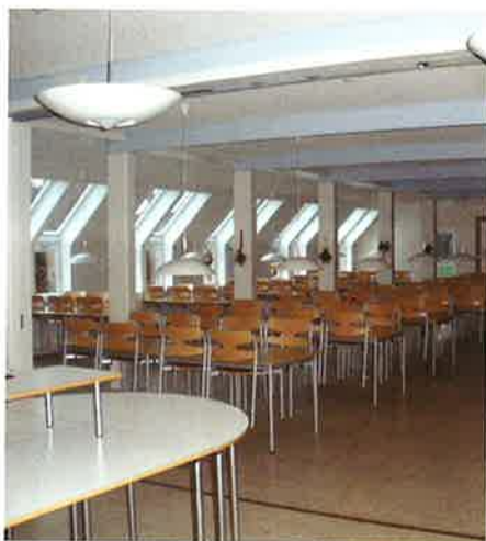
Spisesalen efter modernisering og nye møbler

Da vi nu var så godt i gang, fik vi købt nye møbler til spisesalen og fik foredragssalen givet et ordentligt løft med vandskuring og lyse farver.