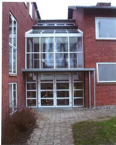
Nyt indgangsparti ud mod græsplænen

Da vi nu var så godt i gang, fik vi købt nye møbler til spisesalen og fik foredragssalen givet et ordentligt løft med vandskuring og lyse farver.