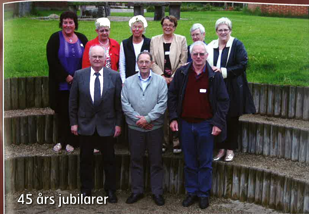
45 års jubilarer