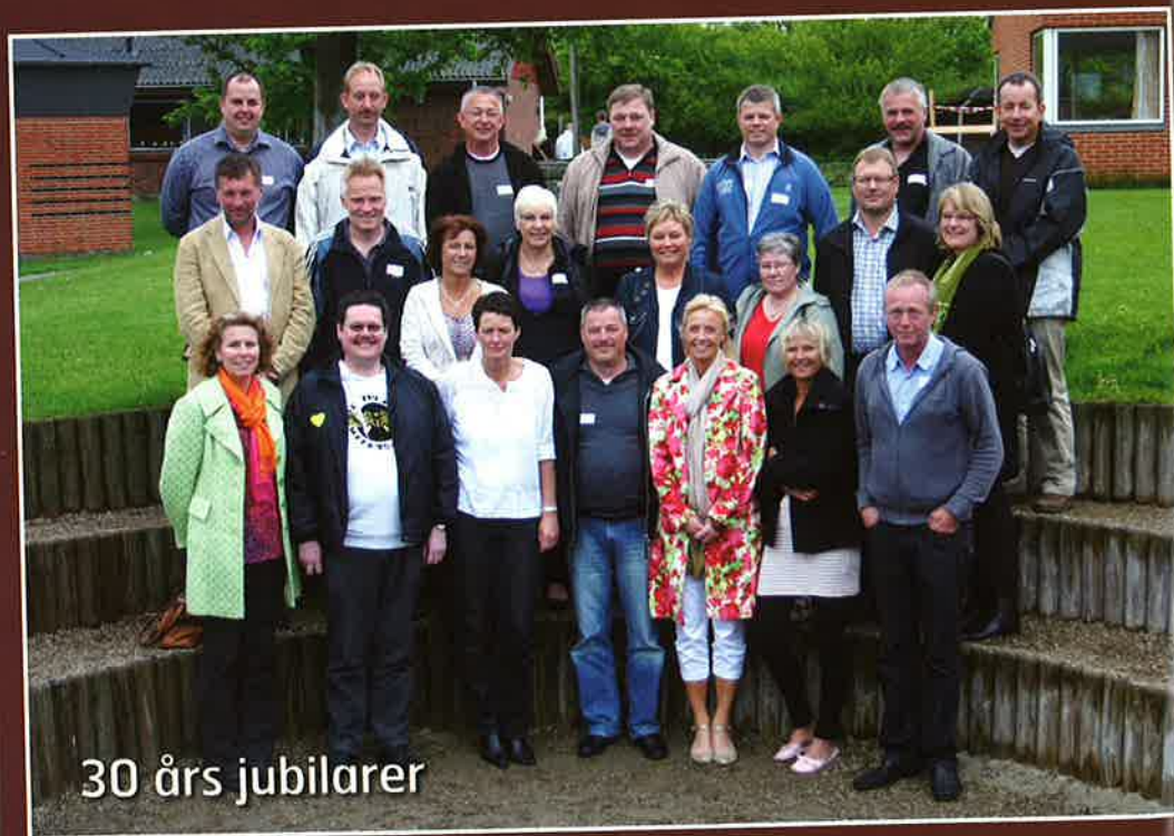
30 års jubilarer