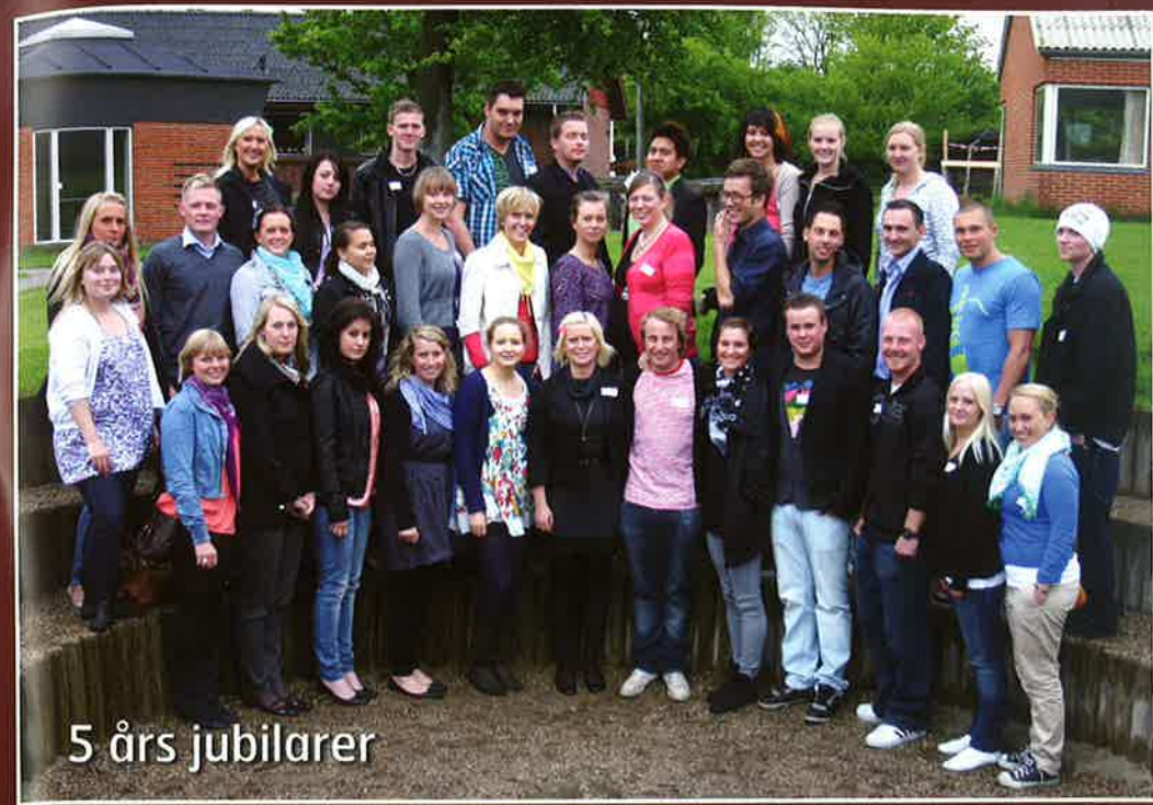
5 års jubilarer