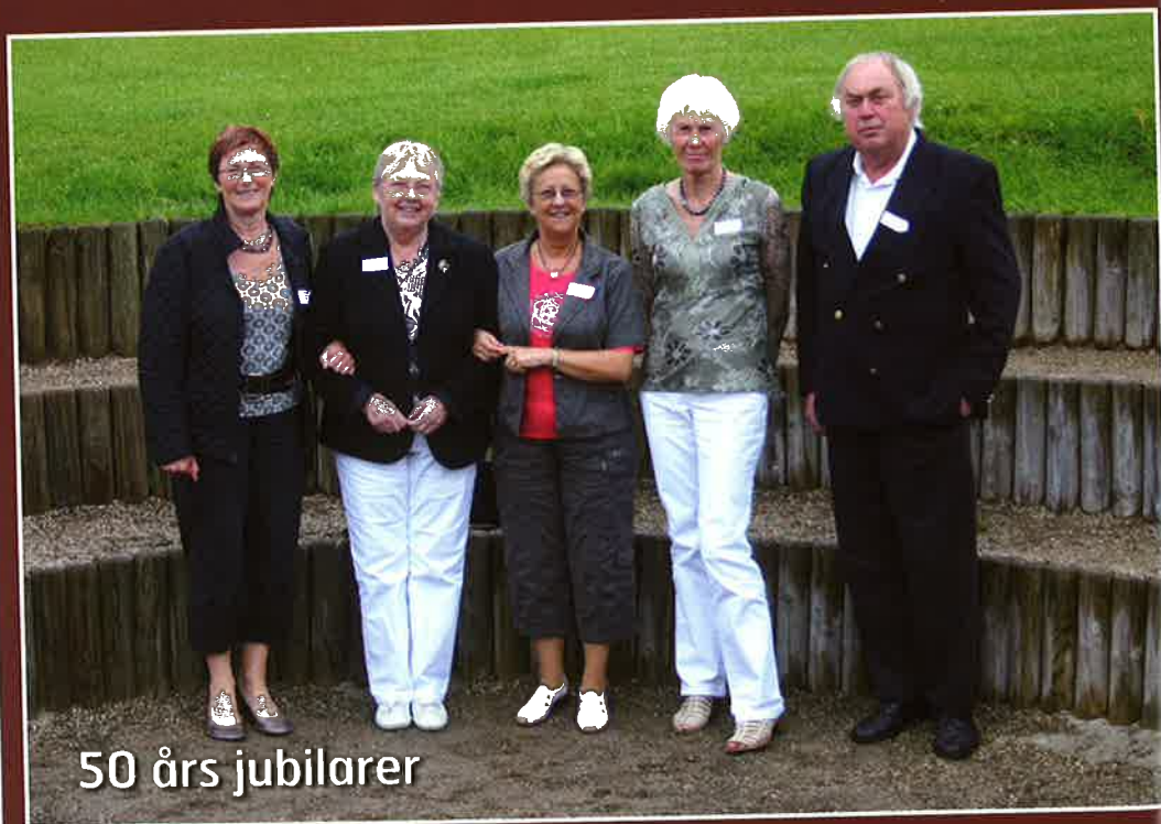
50 års jubilarer