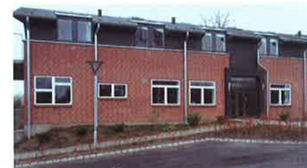
Den nye bygning med kontorer, drengeværelser og faglokaler set inde fra gården. Det ses, at noget af græsplænen er inddraget til p-pladser. Her stod flagstangen før.