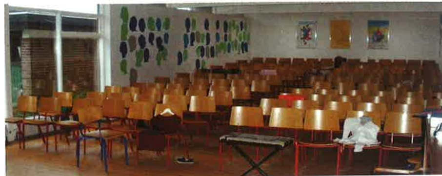
Foredragssalen efter vandskuring og maling

Men vigtigst af alt er dog, at vi går og har det godt her på Ringe Efterskole. Vi har rigtig gode elever, som helt bevidst har valgt denne skole og gerne vil de ting, vi står for. Det gør hverdagen god og bekræftende.