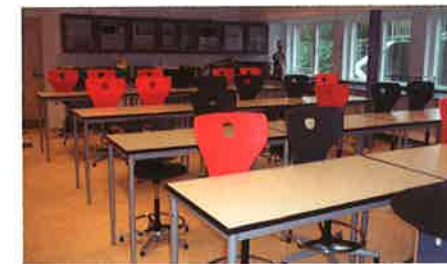
I kælderen i den nye bygning er indrettet biologi og fysik/kemi