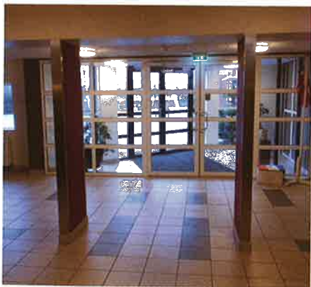
Det nye indgangsparti indefra