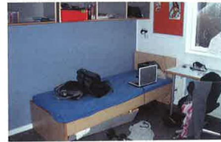
Nyt drengeværelse - ser ud, som det plejer