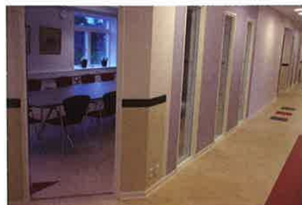
Kontorgangen med kontorer, mødelokale, gæsteværelse og vejledningskontorer