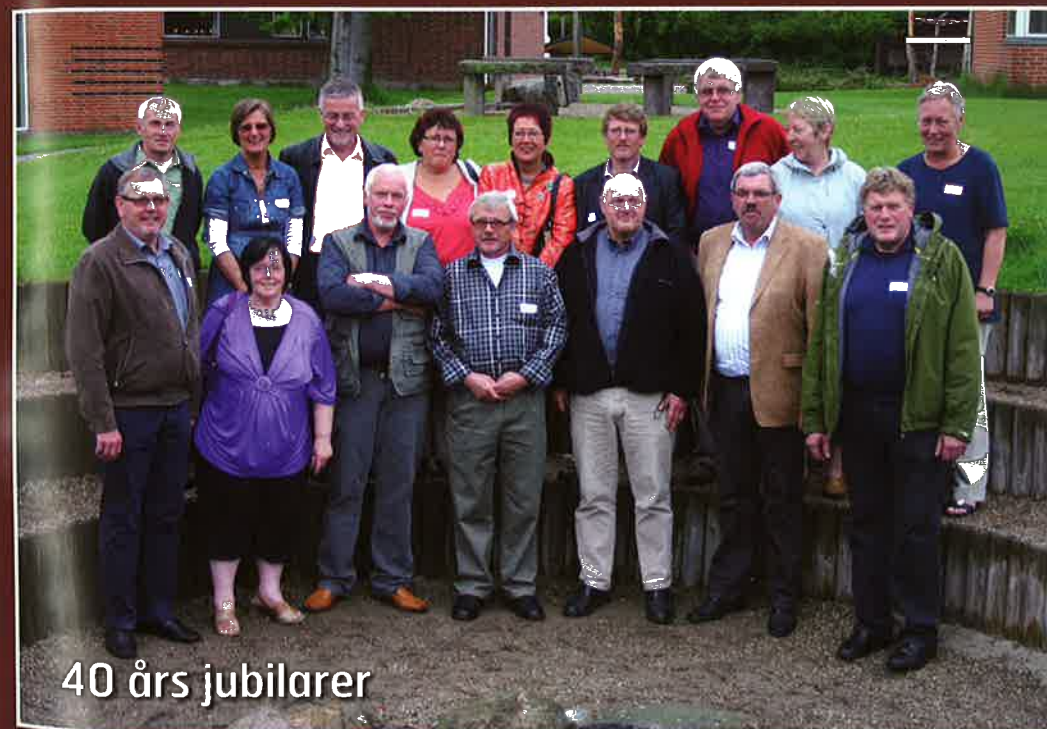
40 års jubilarer