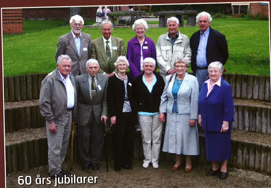
60 års jubilarer