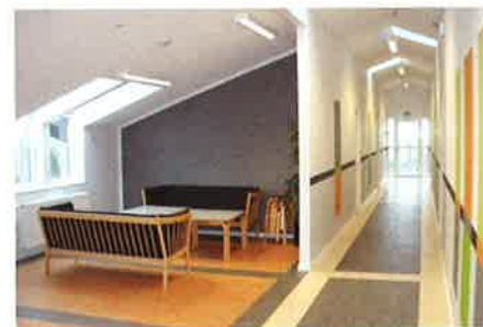
Den nye drengegang "Syden"