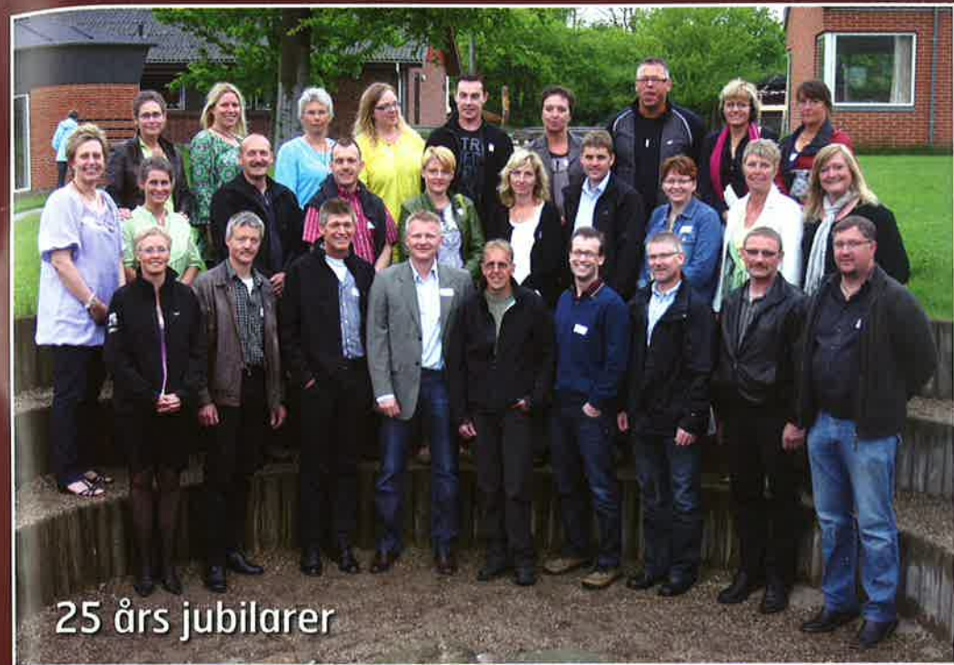
25 års jubilarer