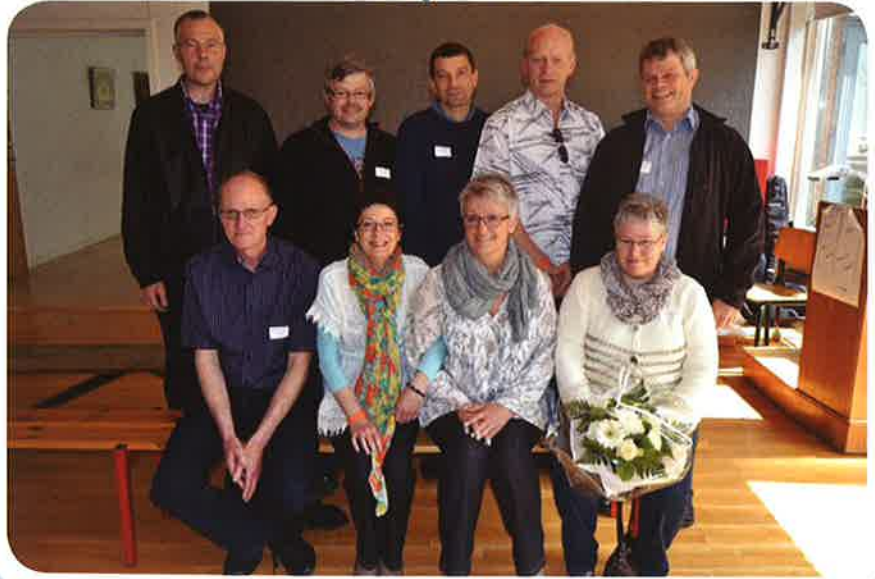
35 års jubilarer