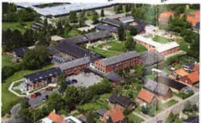
RINGE FRI- OG EFTERSKOLE 2011 - 2012