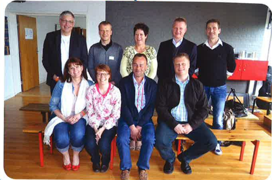
30 års jubilarer