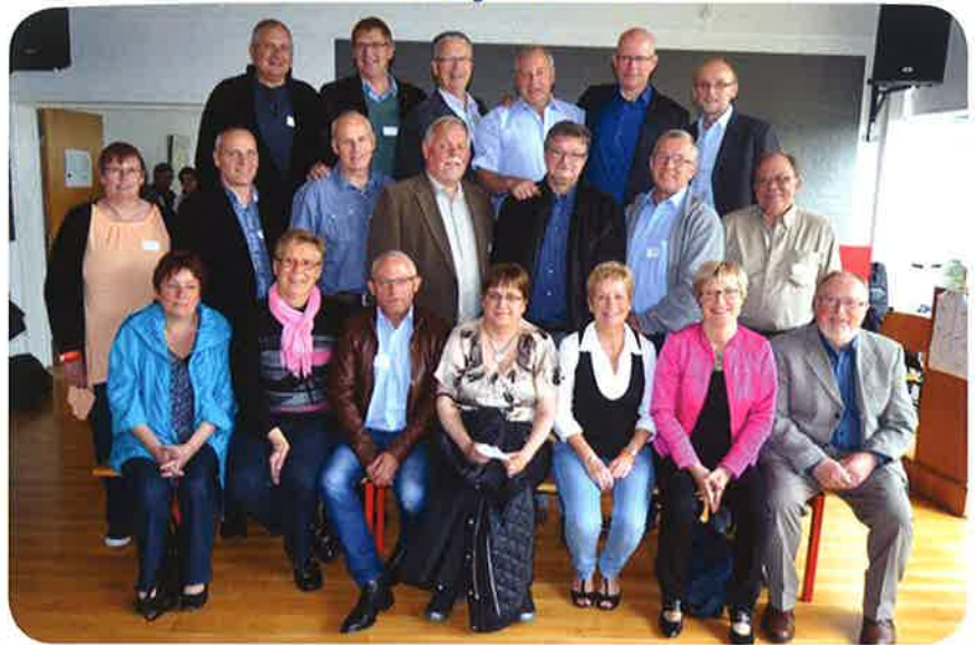
40 års jubilarer