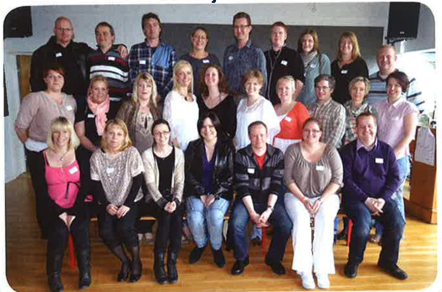
20 års jubilarer