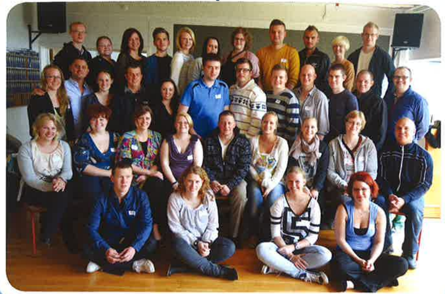
10 års jubilarer