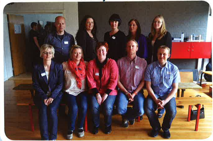
15 års jubilarer